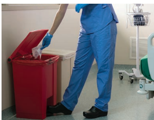
CONTENEDORES STEP-ON LEGACY

Nuestro sistema de manejo residuos ofrece una solución para cada necesidad de recolección. Garantizando la seguridad y bienestar al prevenir la contaminación cruzada e implementando una adecuada separación de residuos tóxicos.