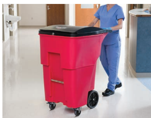
BRUTE® ROLLOUT RESIDUOS DE ALTO RIESGO / BRUTE® ROLLOUT CON PEDAL