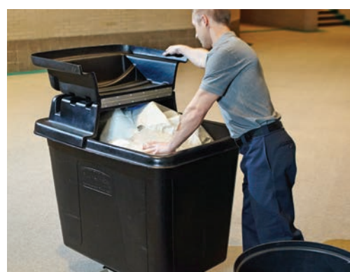
CARROS CÚBICOS CON TAPA / ETIQUETADO DE COLOR