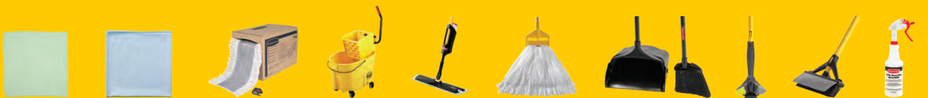
1820582 FGQ63000BL00 FGM15000WH00 FG758088YEL 3486108 2025503 FG637400BLA, FG253100BLA 2018782 2018807 FG9C03060000