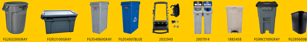
FG263200GRAY FG953100GRAY FG354060GRAY FG354007BLUE 2032940 2007914 1883458 FG9W2700GRAY FG295600BLA