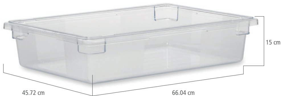
CONTENEDOR DE 32 LT