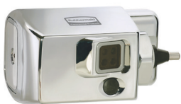
AUTOFLUSH® MONTAJE LATERAL