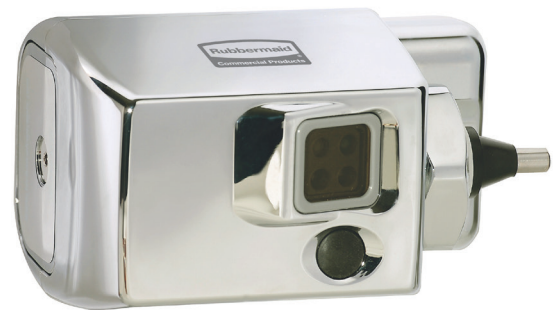
AUTOFLUSH® MONTAJE LATERAL